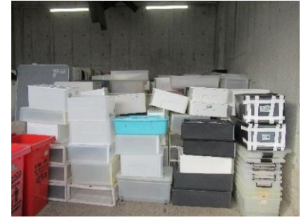
【 プラスチック 】