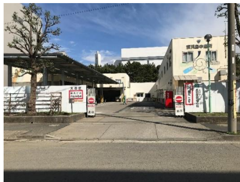
環境資源センター(京浜島)