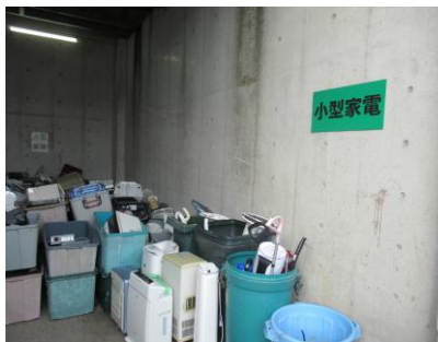
【 小型家電 】