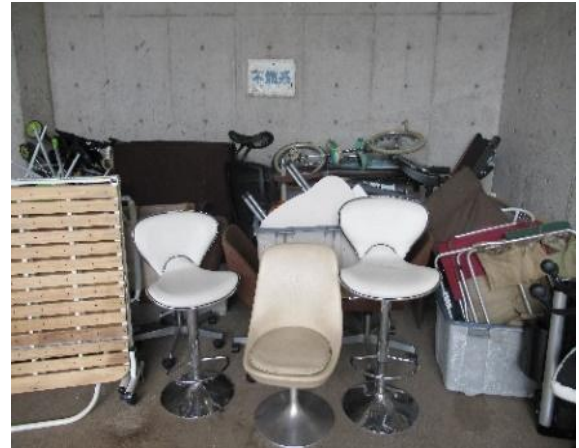
【 不燃ごみ 】