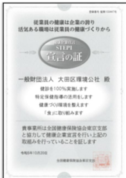
【協会けんぽ「健康企業宣言®」宣言の証】