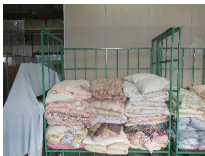
【 羽毛布団 】