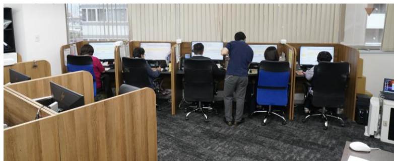
【 受付センターの様子 】

このシステムを円滑に運用し、電話やインターネットによる申告、問合せや相談等に対し、適切に対応していく。