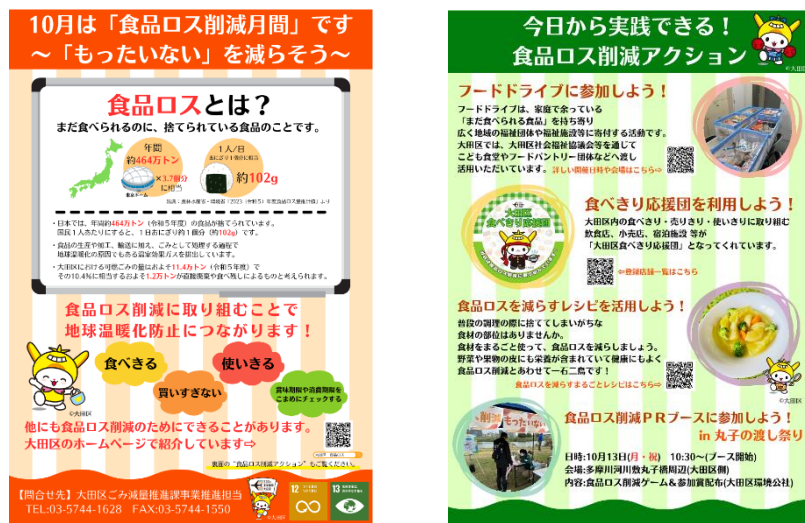
【食品ロス削減月間チラシ】

「食品ロス削減に関する法律」にて制定された「食品ロス削減月間」における普及啓発資材の制作、関係団体への配布調整、広報活動等の業務を行う。