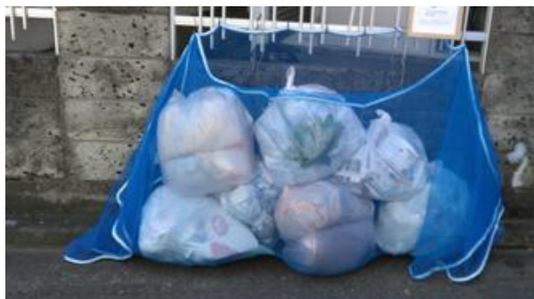
【 防鳥用ネット 】