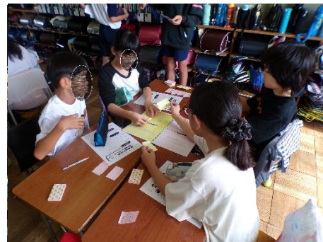
【北糺谷小学校の出前授業 児童によるワークショップ】

また、区民等を対象にした食品ロス削減に関して、地域の要望に沿った出前講座やお祭りなどへ出展する形で啓発活動を実施し、引続き区のSDGs未来都市へ向けた普及啓発を促進する。