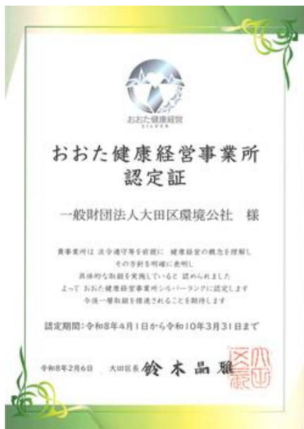
【おおた健康経営事業所認定証】