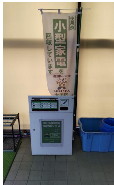
【 小型家電回収ボックス 】