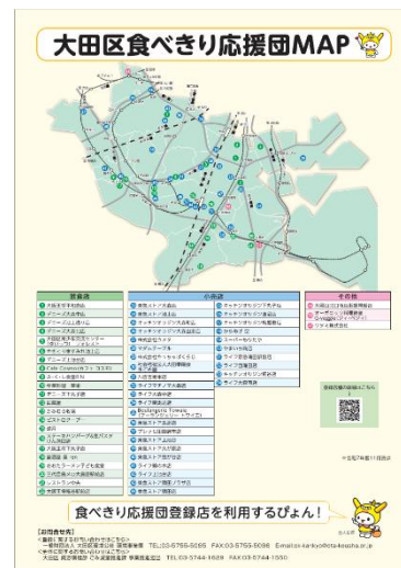
【食べきり応援団啓発チラシ】