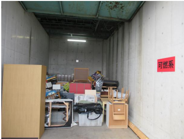
【 可燃ごみ 】