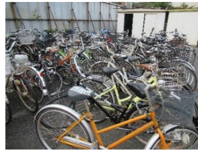
【 自転車 】