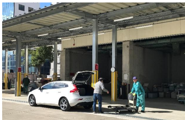
【 環境資源センターにおける自己持込受入の様子 】